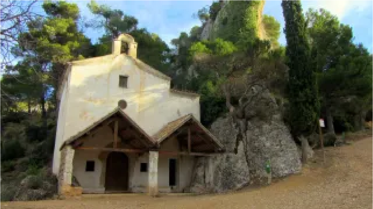
Ermita de la Foia

La iglesia parroquial de la Natividad de la Virgen María alberga un impresionante retablo gótico datado del siglo XIV , que se atribuye a la escuela de Borrassá. Este retablo es una muestra destacada del arte gótico de la región.