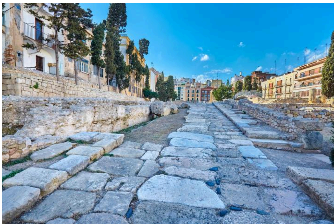
La ciudad de Tarragona.

Durante el franquismo, las autoridades impusieron el castellano como única lengua oficial, relegando el uso del catalán y sus topónimos tradicionales. Por ello, muchos municipios vieron sus nombres traducidos o adaptados al castellano por decreto. No fue hasta la llegada de la democracia que la mayoría de los pueblos recuperaron sus nombres originales en catalán. Todos menos uno que mantuvo su denominación en español.