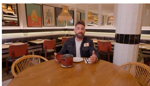
L'últim "Joc de cartes" buscarà cuina tradicional catalana a Barcelona