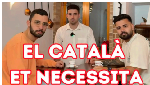
La divertida campanya de l'Ajuntament de Pollença per relançar el català entre els joves