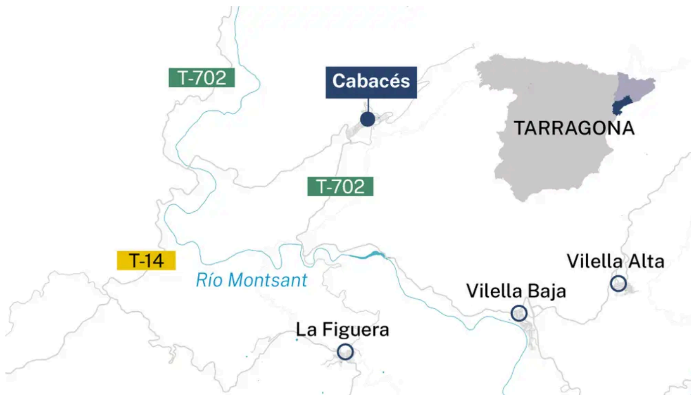
Cabacés A. CruzLa Razón

Los vecinos argumentan que este es el nombre con el que siempre se han sentido identificados , por lo que se oponen al cambio de lengua. Sin embargo, partidos como ERC y Junts han insistido en impulsar el cambio a Cabassers, aunque para la modificación se necesitaría el voto del pueblo.