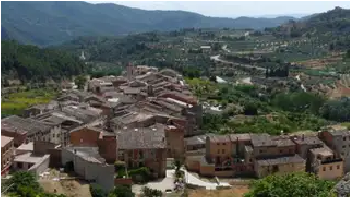
Cabacés Ajuntament Cabacés

Es el único municipio catalán que conserva su nombre en castellano