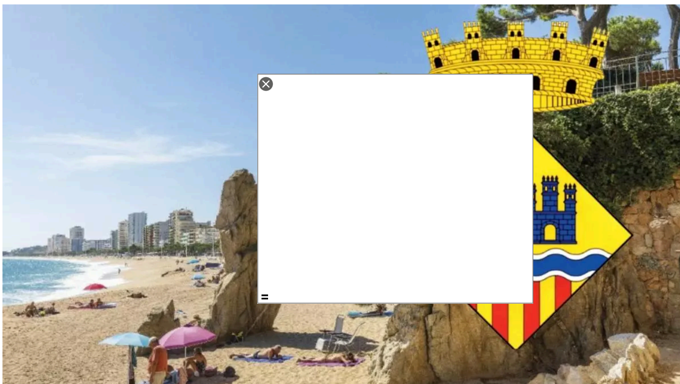
El nou escut de Castell d'Aro, Platja d'Aro i s'Agaró.

L'escut municipal no s'ajustava a la normativa heràldica