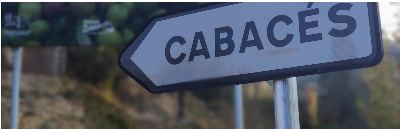
Cartells a l'entrada de Cabacés