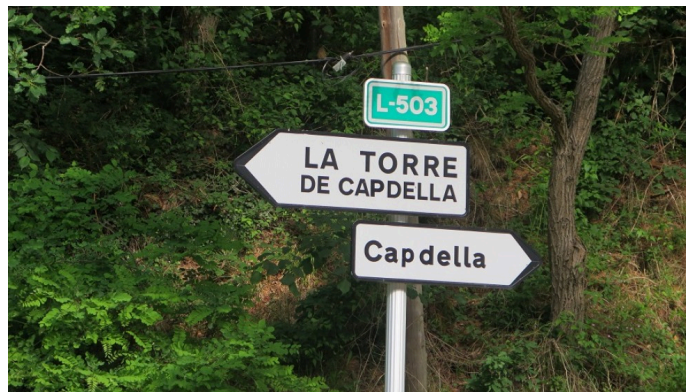
Detall d'un senyal de trànsit amb Capdella escrit amb 'p' | Ajuntament

Pallars | 26 de juliol de 2022 a les 12:53