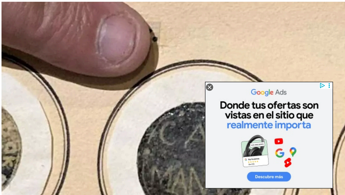
Un segell original del segle XV de Capmany guardat a la Biblioteca de Peralada.

Descarten que estiguin incomplint la Llei de memòria democràtica i que s'hagin de dir «Campmany» i «Lledó»