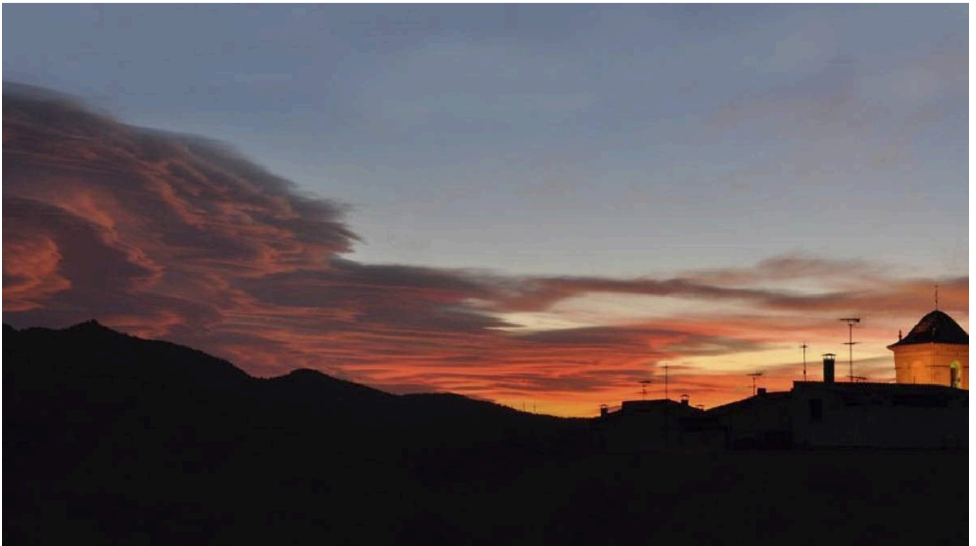
L'ermita de la Foia, a Cabacés

La cambra alta requereix també a Rialp, Lladó i Capmany que substitueixin la toponímia franquista en aplicació de la llei de memòria democràtica