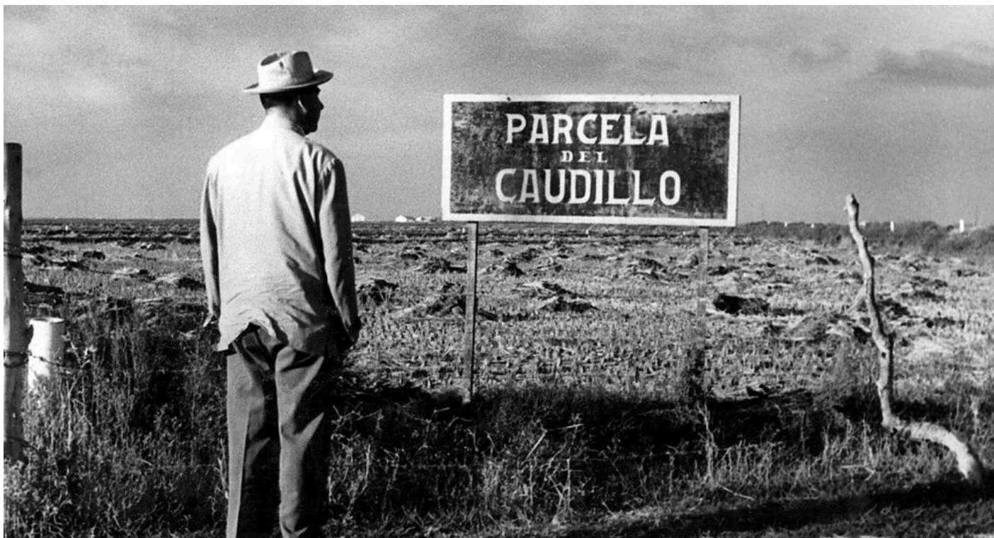
El último legado del Franquismo

Los pocos pueblos que todavía quedan en España con nombres dedicados al caudillo y a generales del régimen ofrecen un férreo rechazó a cambiarlos como dicta la nueva ley