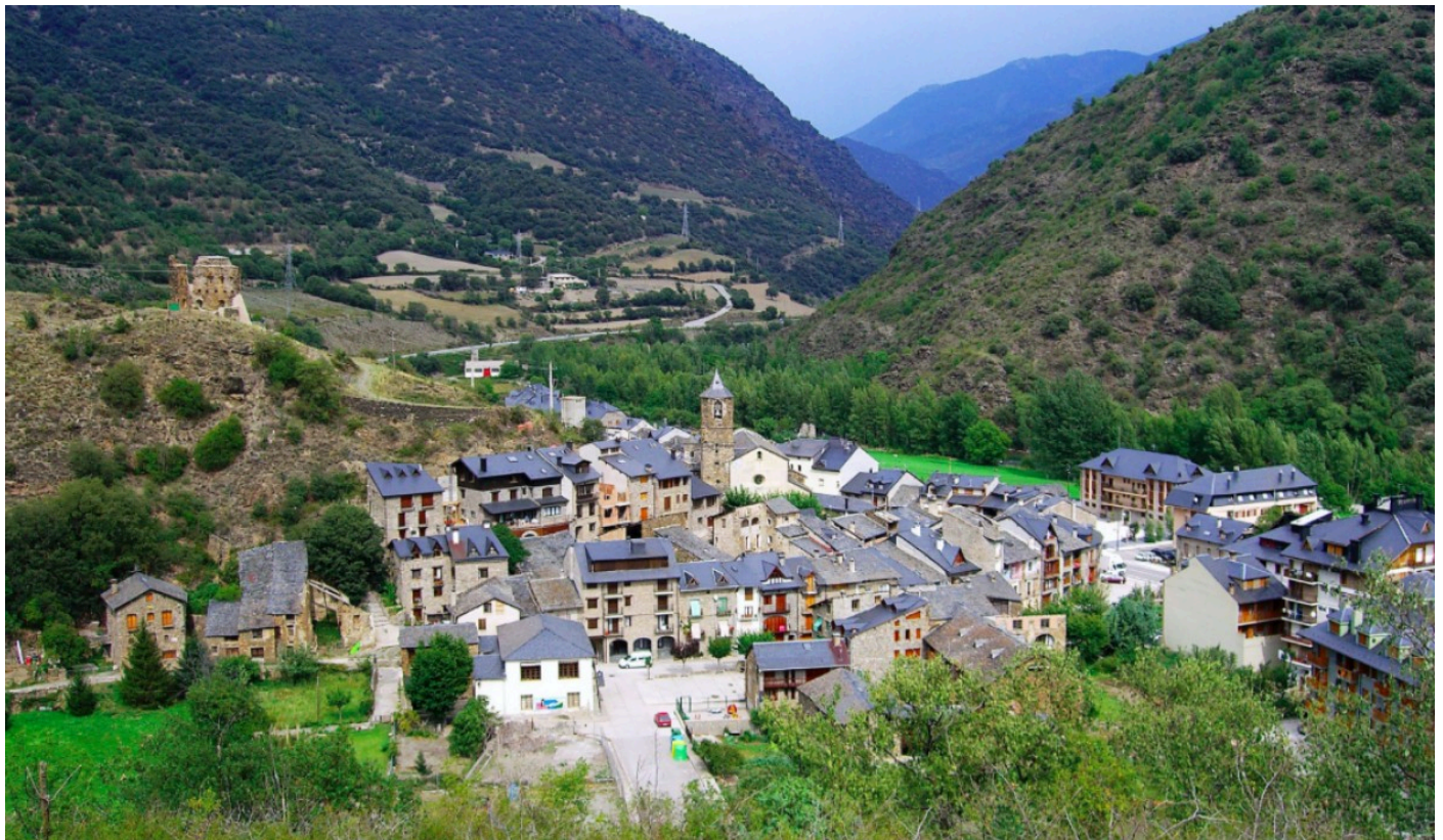
Rialp, un dels municipis afectats pel canvi de nom, en una imatge d'arxiu

La cambra alta espanyola també requereix a Rialp, Cabacés i Capmany que substitueixin la toponímia franquista en aplicació de la llei de memòria democràtica