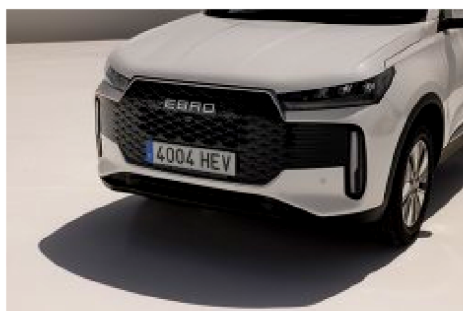
Nuevo EBRO s400 Híbrido.

Y eso que apoyos en las redes sociales no les han faltado. Incluso el expresidente de la Generalitat, Quim Torra , ha dado difusión a algunas de sus cuentas en la red social X: en concreto, a una que lleva por nombre "Cabassers #oficialitat".