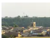
El poble de Lleida de menys de 800 habitants que rebrà 5 milions d'euros per reformar el barri antic