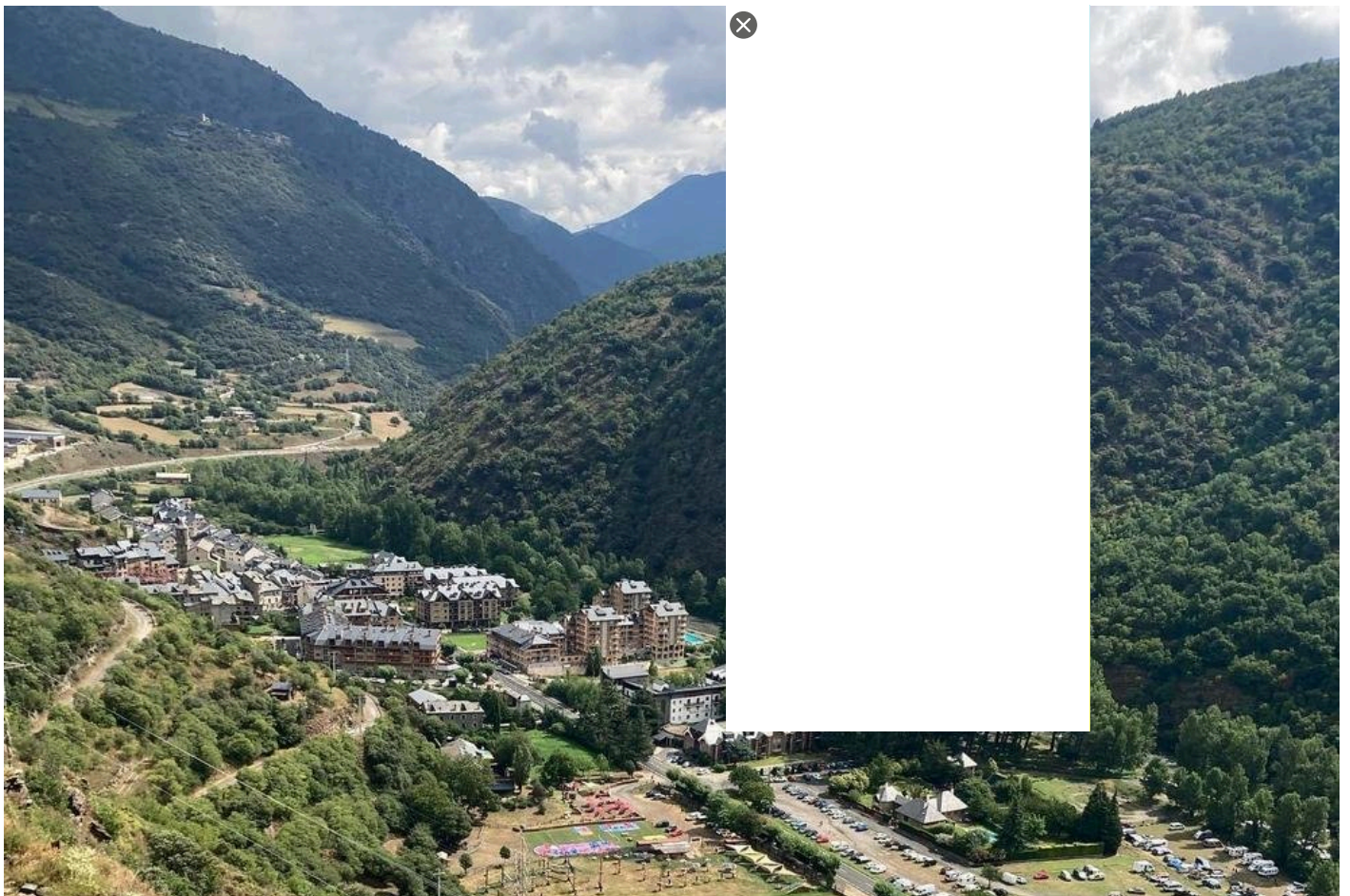
Vista de Rialp.