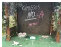
Roben les figures i vandalitzen el pessebre de Sort: "vandalitzat, pintat i buit"