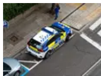
Detinguda una jove de 19 anys per intentar matar a la seua exparella amb un ganivet a Lleida