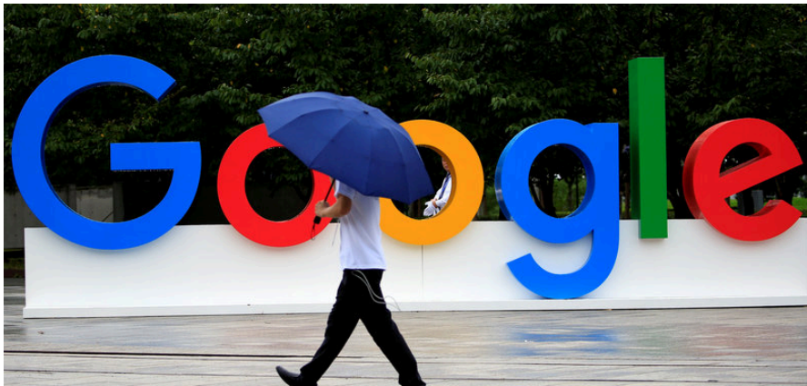
Pla general de les lletres de Google durant una conferència sobre intel·ligència artificial

■ La proposta de resolució també reclama que l'algoritme de les recerques "no invisibilitzi" el català